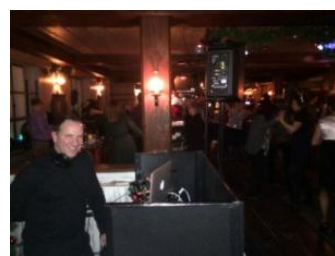
Table d'hôte de 4 services, Disponible sur réservation seulement INCLUANT L'ANIMATION DU DJ PIERRE ARBOUR !

COCKTAIL DES FÊTES à la Blanche de Chambly et Canneberges Option sans alcool : Le MOÛT DE POMMES de Michel Jodoïn